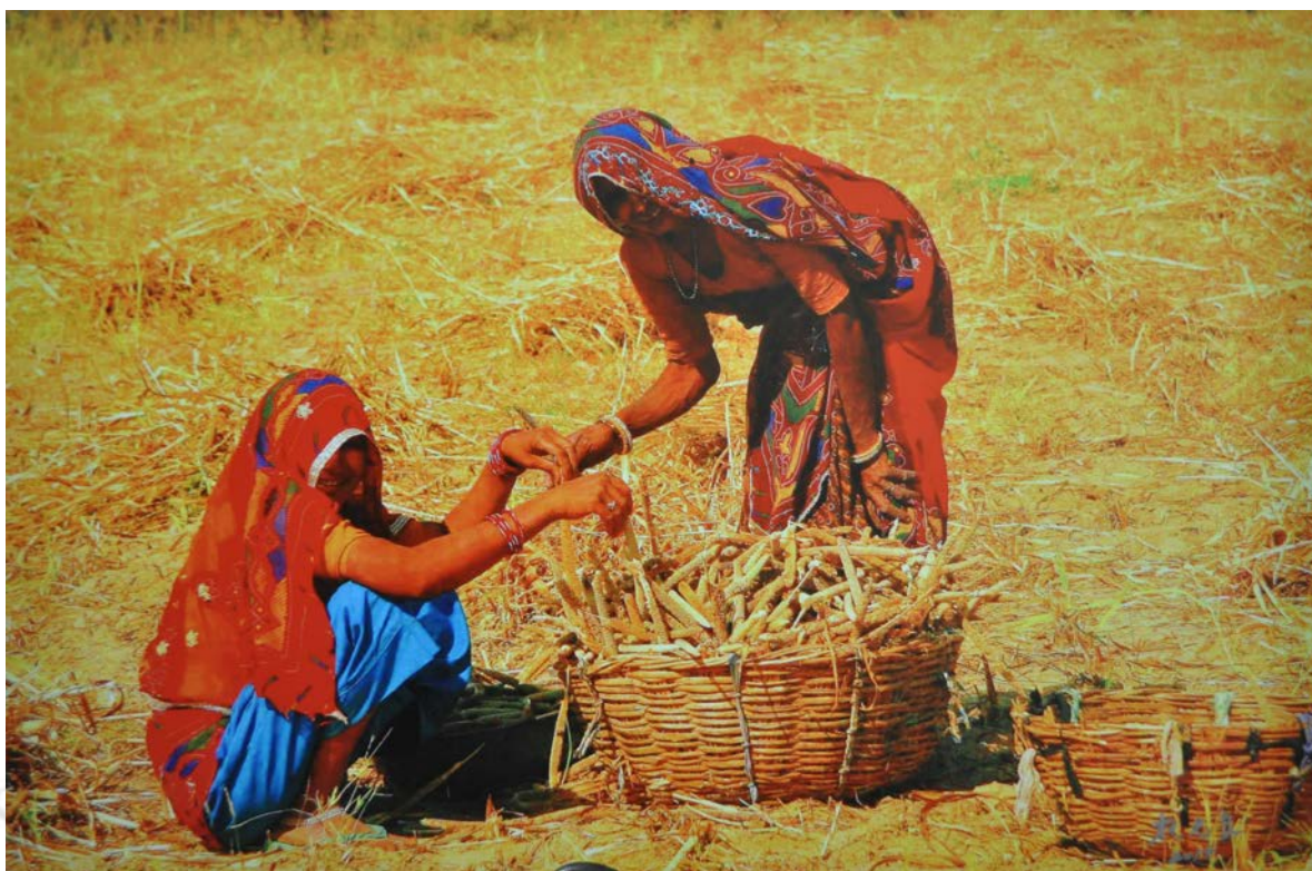
作品名稱：拾穗(拍攝於印度)