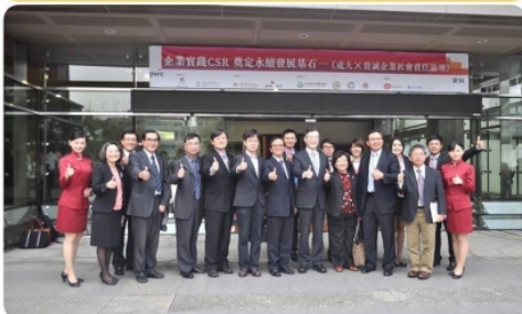
與會貴賓與成大會計的成員於國際會議廳前合影。