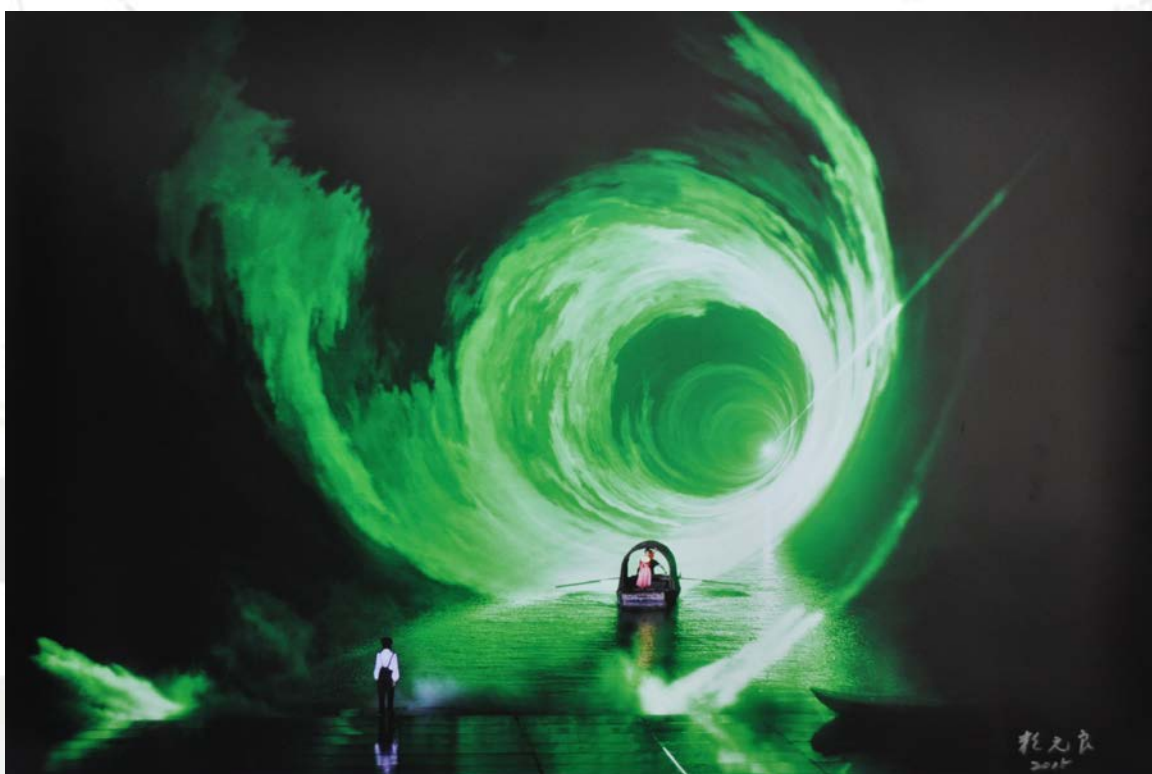
作品名稱：穿越時空隧道來相會(拍攝於大陸鄭州)