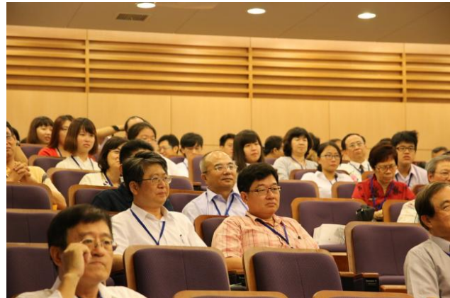
當天參與系慶大會的系友們。