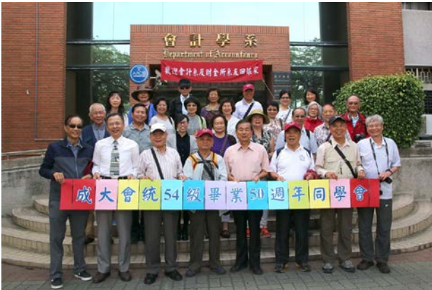
54 級系友在會計系館前合影