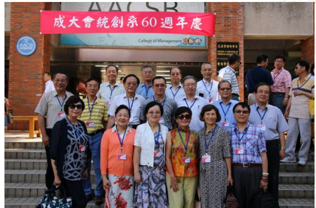
統計系館前系友合照。