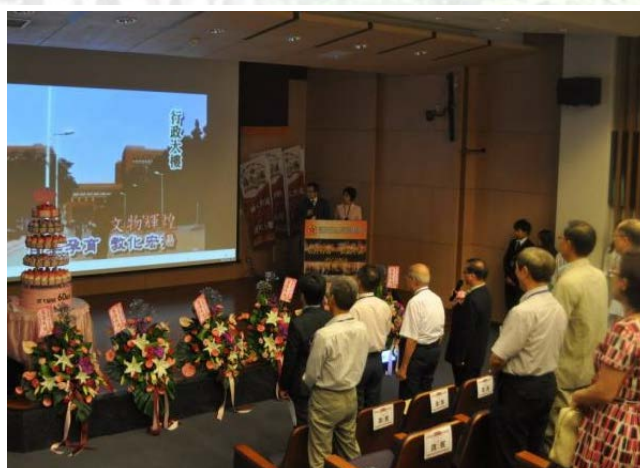
系慶大會上唱校歌儀式。