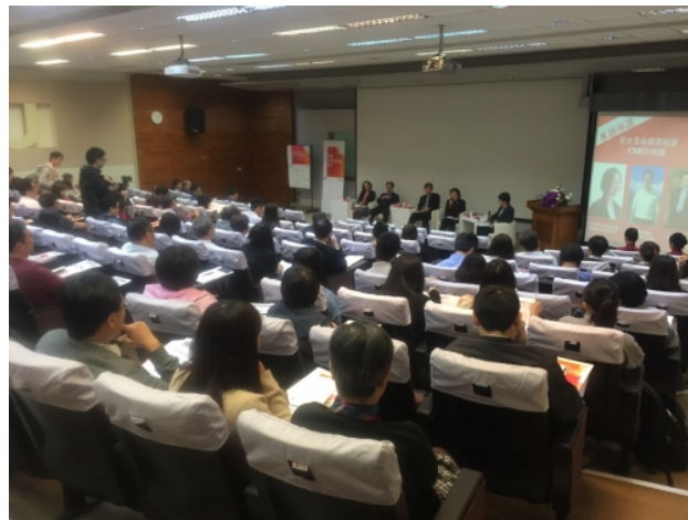
企業社會責任論壇演講實況。