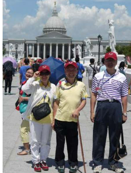
系友們在奇美博物館館前合影。