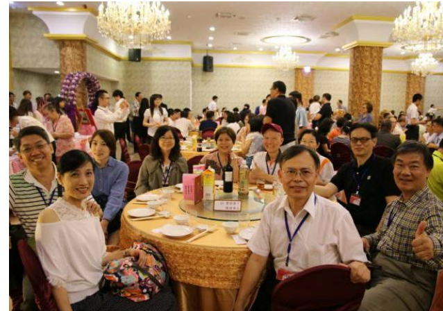
系友們在濃園滿漢餐廳參與實況。