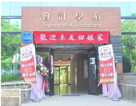
會計系館在系慶活動當天實況。