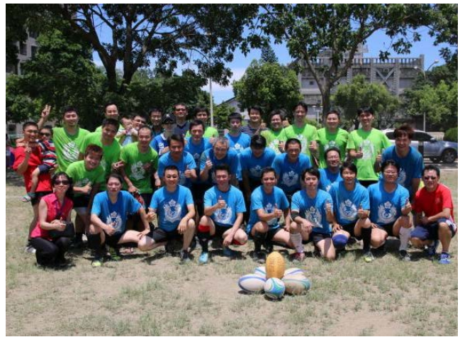
橄欖球賽參與之系友，地點為自強校區。