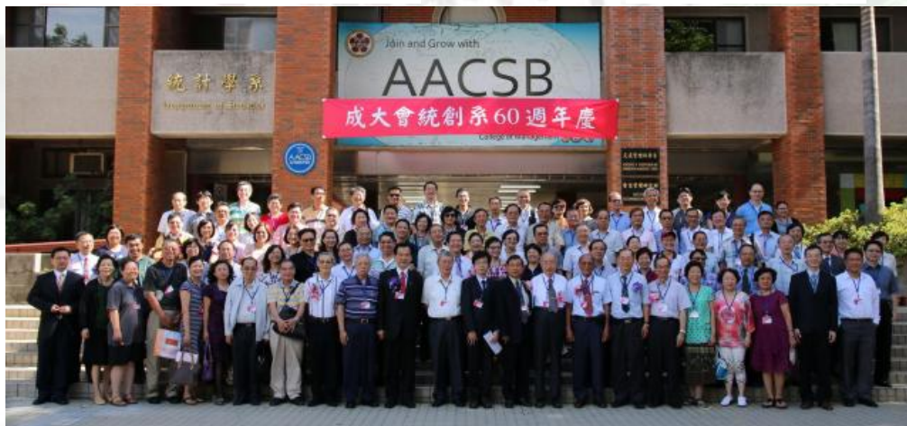
參與快統60周年系慶的會統大家族在統計系館前的大合照。