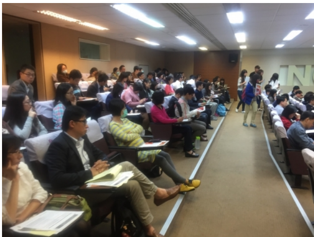
企業社會責任論壇演講實況。