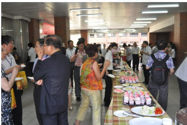
系慶大會中場休息時備有精緻茶點供系友們享用。