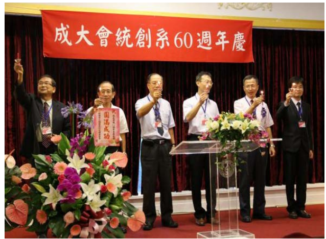
系慶晚宴活動之一的薪火相傳，象徵著將會統的精神生生不息的延續下去。