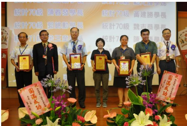
系慶大會上頒發感謝狀給予長期關懷母系的學長姊。