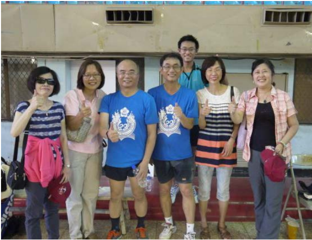
羽球賽參與之系友，地點為中正堂。