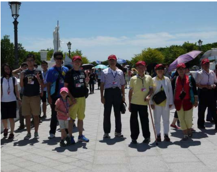
系友們在奇美博物館的合影。