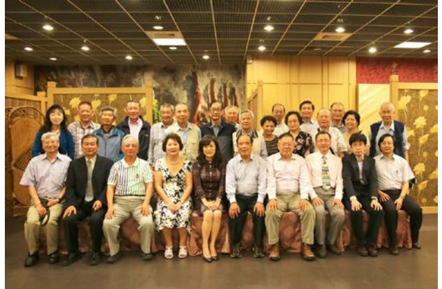
54 級系友在雨荷舞水餐廳合影