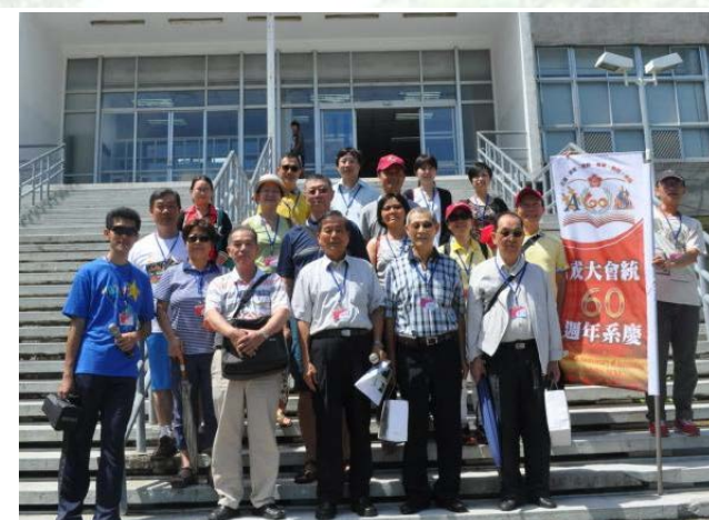
系友們以及會計、統計系師長在舊總圖書館(現為自修閱覽室)前合影。