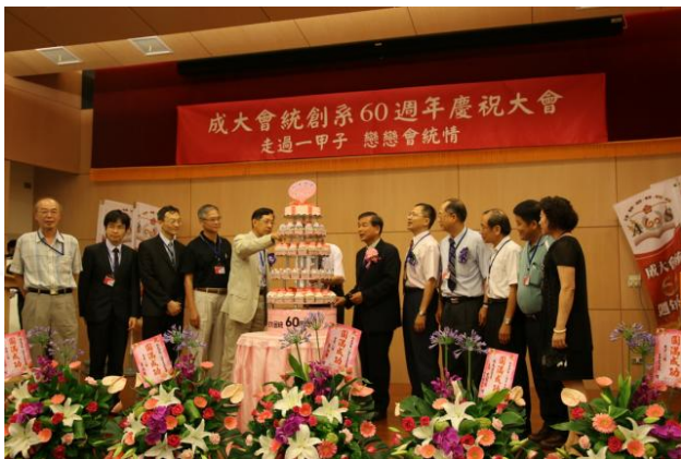
師長與系友們一同切60週年生日蛋糕。