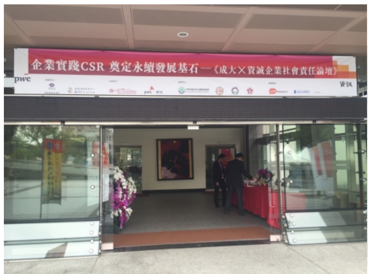
企業社會責任論壇在國際會議廳的現場。