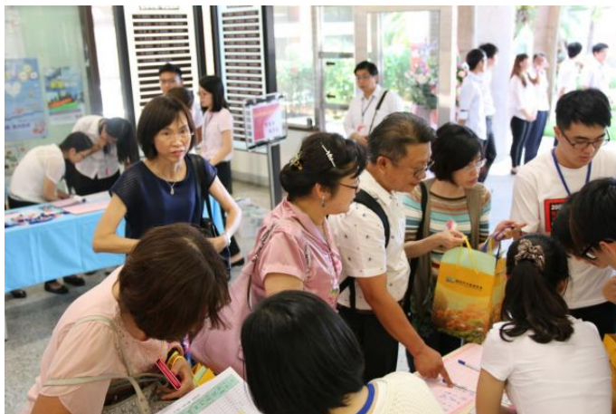
在管理學院中庭報到處的實況。