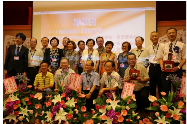
獎勵給本次活動出席最踴躍的62級學長姊。