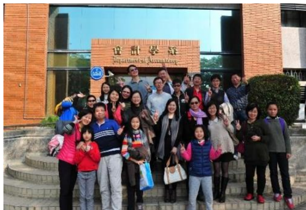
83 級系友回娘家合影