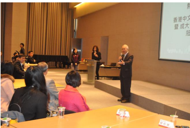
香港中文大學師生參訪台新金控時合影