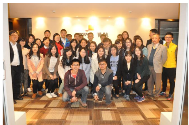
香港中文大學師生參訪資誠聯合會計師事務所時合影