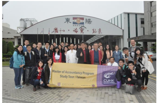
香港中文大學師生參訪東洋事業集團時合影