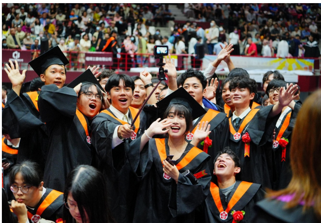
學生開心參加畢業典禮

期許畢業生，在成大淬鍊後，如朝陽般閃耀，開啟人生新篇章。國立成功大學 6 月 7 日舉行 114 級畢業典禮，在「成曦」為主軸的勉勵下，歡送逾 6 千名畢業生步出校園，期許發揮所學，大步向前邁進。沈孟儒校長以「窮理致知，科學濟世」為題致詞，叮囑畢業生們，成大的精神從不是競爭的勝利者，而是共好的實踐者。成為別人生命中的貴人，是一種境界，也是一種力量。成大 114 級畢業生人數 6218 人，學士班 2650 人，碩士班 3345 人，博士班 223 人。其中，境外畢業生人數約 507 人。專為培育高階半導體專業人才的「智慧半導體及永續製造學院」，今年計有 70 名碩班畢業生，包