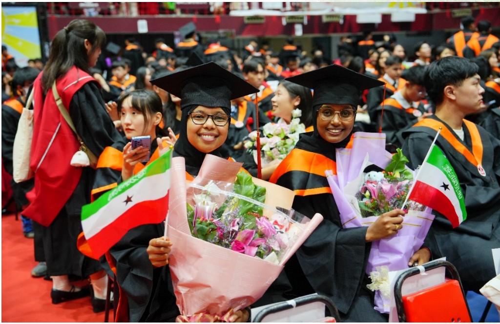
外籍學生帶著母國國旗參加畢業典禮