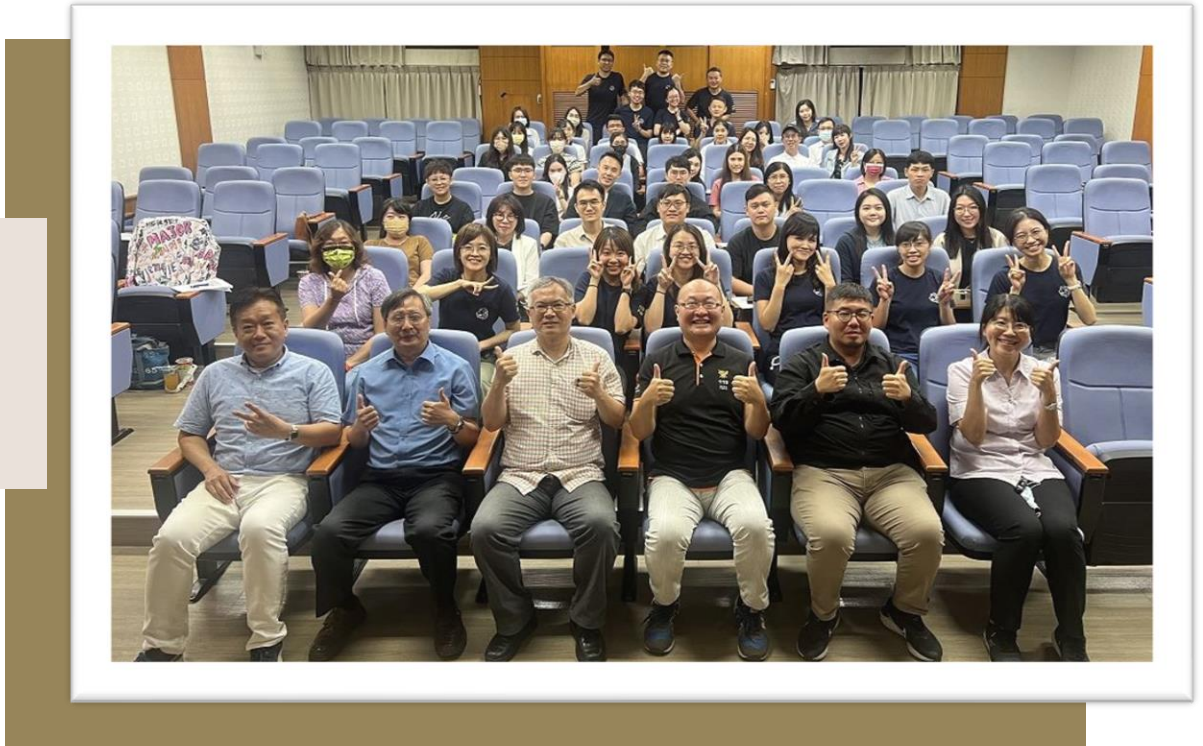
▲ 財金所在職專班新生說明會大合照