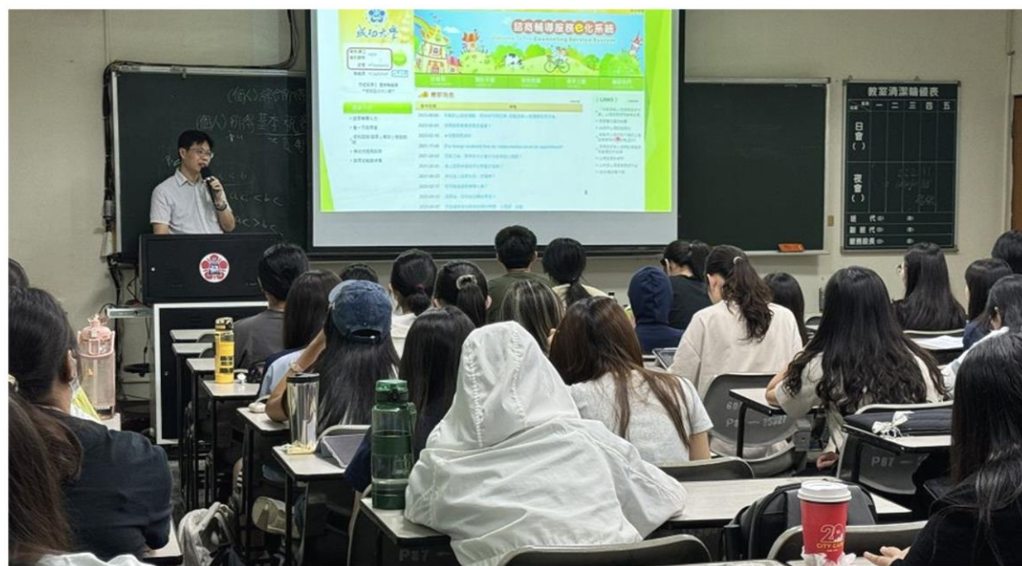
▲ 成大心理健康與諮商輔導組說明