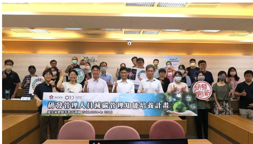
▲ 成大辦理「全校型研發管理人員減碳管理知能培養教育訓練」，培育淨零永續人才與技術

成大因應政府積極推動 2050 年溫室氣體淨零排放的目標政策，將持續辦理研發管理人員減碳知能培養教育計畫，延續永續治理理念，為相關單位及所屬同仁提供專業的減碳管理知識培訓，以因應全球溫室氣體排放議題。培訓內容著重於溫室氣體發展趨勢及管理制度、溫室氣體盤查查證重點及流程規劃，期引導相關單位規劃節能減碳策略，共同達成減碳目標。