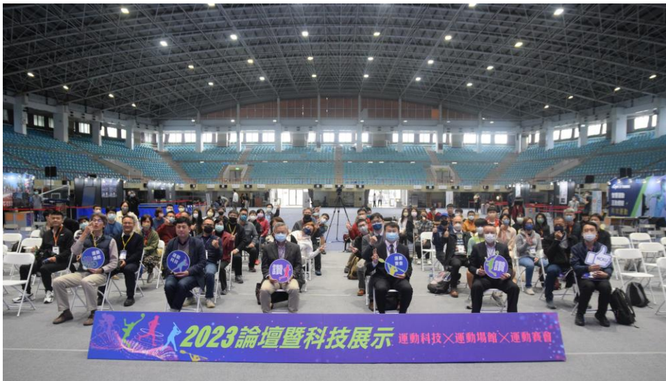
▲ 由教育部體育署指導的 2023 運動科技論壇暨展示 1 月 7 日在成功大學中正堂舉辦

科技X運動場館論壇，著眼於透過在場館內部安裝的科技設備，分析並強化運動者之體能。從本次分享的新興智能場館商業模式中，就能看見多方合作的元素、由學界提供技術，以及產業界的研發與行銷能力，以此呼應官方提倡的運動科學趨勢，期待隨著科技的革新，能與運動展開更普及與完整的結合。