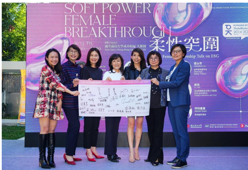
▲ 成大蘇慧貞校長邀請與會成員，共同簽署「2023《女性領袖永續聲明》」

全球發展永續議題為未來世代所面臨的重要挑戰，配合聯合國的「2030 永續發展目標」（SUSTAINABLE DEVELOPMENT GOALS, SDGS），會中也由成大蘇慧貞校長邀請與會成員，共同簽署「2023《女性領袖永續聲明》」，透過支持女性行動，盼能為世界帶來更好的經濟成長，鼓勵女性成為改變世界的永續力量。