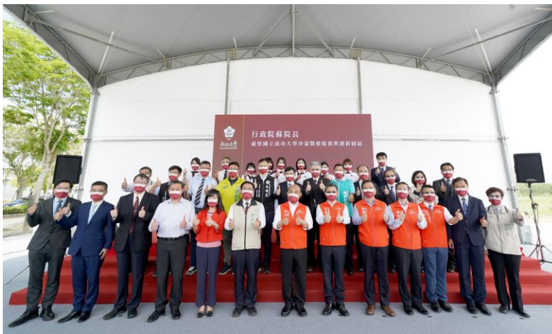
▲ 國立成功大學「沙崙醫療服務與創新園區」 是產官學攜手創新的典範

台南市立法委員王定宇 17 日晚間在臉書透露，行政院蘇貞昌院長已簽字批核「成大醫院沙崙院區建設計畫」，第一期總經費 92.8 億，中央補助 47.8 億，國立成功大學附設醫院負擔 45 億，將以教學醫院支應預算，未來還有醫療產業園區、「急重難罕」醫療中心的部份，會再有相對應的預算。行政院 2021 年 12 月 31 日核定「國立成功大學沙崙醫療服務與創新園區先導計畫」。成大沙崙醫療創新園區與臺南市政府合作，2022 年為園區元年，第一期工程將在 2023 年展開，希望順利延續第二期工程，成大也希望盡快開始與台南市府討論進行第三期工程相關規劃。成大沙崙醫療創新園區除積極推動全臺首座醫療服務創新與生醫產業為發展主體的科學園區外，積極完成設立成大沙崙醫院的規劃，除了以兼顧區域需求、兒童醫學與國際醫療，也具有平衡城鄉差距、優化罕病照護、發展特色醫療、精進尖端醫療的服務特色。