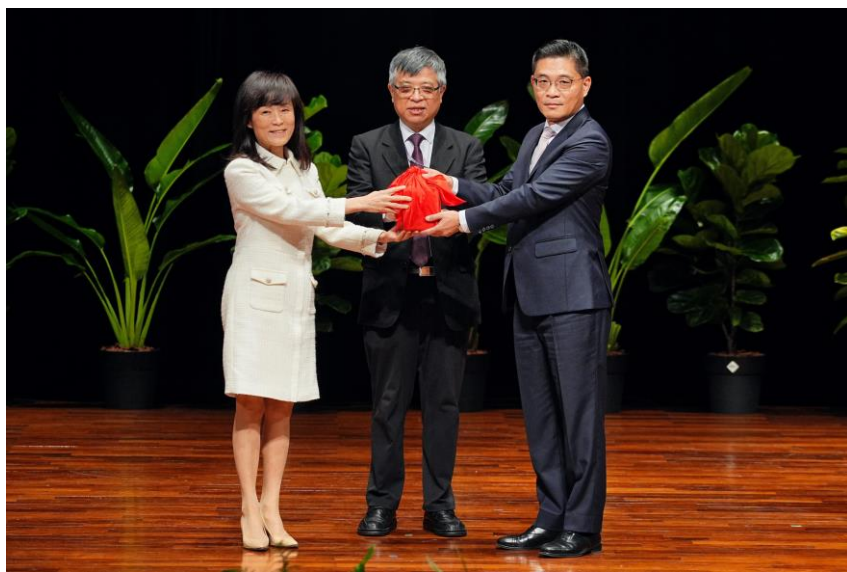
▲ 成功大學第 18 任校長沈孟儒（右）從卸任校長蘇慧貞（左）手中接過印信，正式就任成功大學校長

國立成功大學 2 月 1 日於光復校區成功廳隆重舉辦新、卸任校長交接典禮，在教育部政務次長劉孟奇的蒞臨見證下，第 18 任校長沈孟儒從卸任校長蘇慧貞手中接過印信，就任成功大學校長。