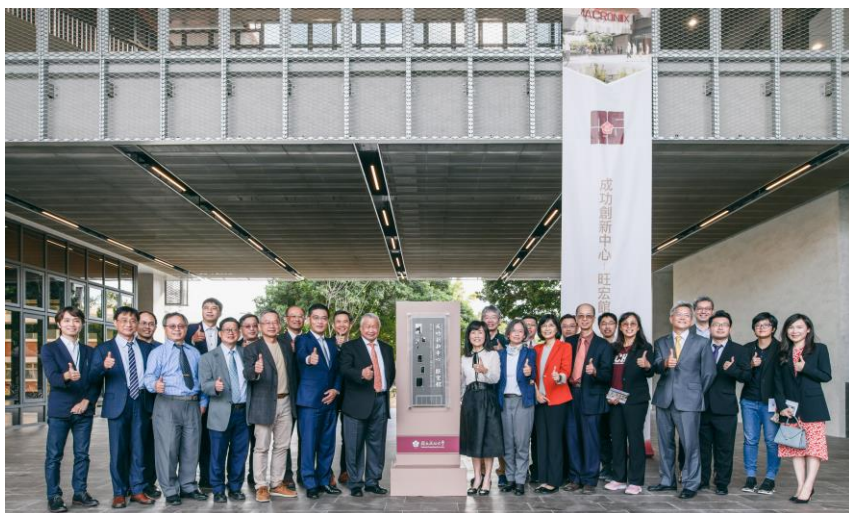
▲ 成功創新中心—旺宏館於 2020 年 6 月動工， 2023 年 1 月揭牌

超過半世紀以前，勝利校區前方的「原總圖書館」K館於 1959 年落成，是戰後美援時期最具代表性的現代主義建築之一，標示著新的時代的到來，遙望對面成大 1931 年創校後的行政大樓，也就是現在的博物館。64 年後，比鄰而起的「成功創新中心-旺宏館」，成為新型態提供研發的創新教育空間，在成大校園空間上將「博物館—原總圖書館」連成一氣，也呈顯了在時間軸上「歷史—現代—創新」演進關係，深具意義。