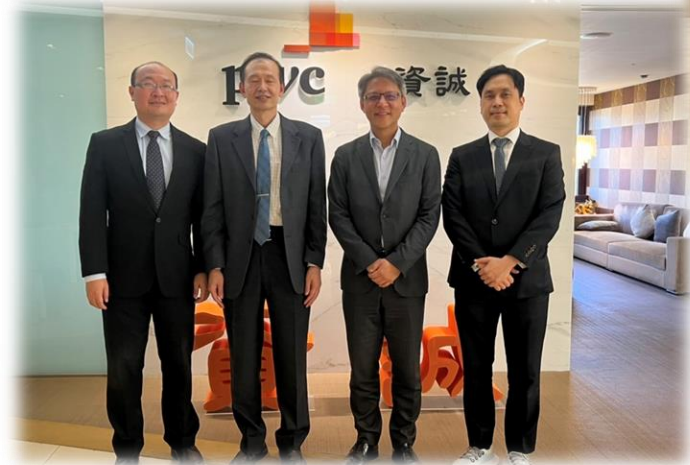
▲ 資誠聯合會計師事務所