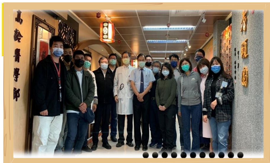
◀ 成功大學智慧健康照護跨領域團隊成員合照

因應 2025 年台灣進入超高齡社會之議題，高齡族群之福祉及相關健康照護產業之發展刻不容緩，目前智能回饋輕量化健康促進訓練系統在成大醫院高齡醫學部以及出院病患之遠端居家復能的使用上大獲好評，許多高齡長輩以及家屬都引頸企盼相關產業投入資源量產，讓這個福祉科技能夠造福更多的家庭。成大前瞻醫材中心亦將持續深化與健康照護產業之互動關係，讓成大跨領域研發成果開枝散葉。