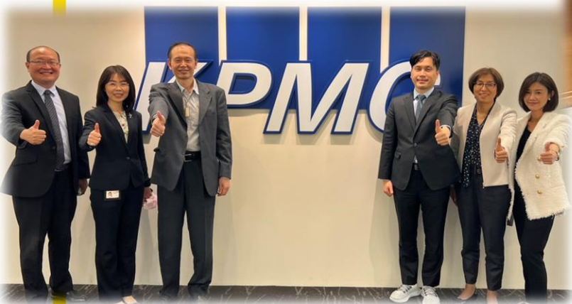
◀ 安侯建業聯合會計師事務所