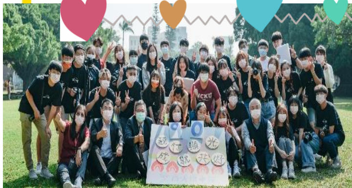
◀ 開幕貴賓與單車節學生團隊

成大單車節2021年的報名人數為4060人，實際參與超過1萬5000人，而2022年報名人數已突破5000人，預計現場也將吸引破萬人入場。3月5至6日的第15屆成大單車節活動皆免費入場，僅部分須事前報名，敬請留意「成大單車節」FB粉專公告。