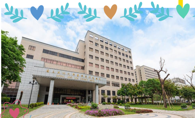
成大醫院門診大樓 ▶

國民健康署提醒，民眾可多利用政府提供的四大癌症篩檢（大腸癌、口腔癌、乳癌、子宮頸癌），若對身體出現症狀有所疑慮，請務必盡早就醫進行篩檢診斷；一旦確定罹患癌症，則一定要選擇通過癌症診療品質認證的醫院就醫，確保患者能接受一致且優質性之癌症診療照護服務。