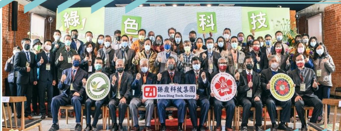
▲ 2021 綠色科技論壇暨論文頒獎典禮與會來賓合影

綠色科技論文獎以「發展科技、造福人類；精進環保、讓地球更美好」為辦理理念，自2013年逐年辦理至今。今(2022)年共有84篇與環境科技、氣候變遷與永續發展議題相關的碩博士論文參選，由專家學者組成評委會，依據論文主題契合性、創新性、未來應用價值及正確度與嚴謹度等4項標準進行審查。最終選出12篇優秀論文，博士組共4名，分別頒贈獎金15萬元；碩士組共8名，分別頒贈獎金10萬元，總獎金高達140萬元。