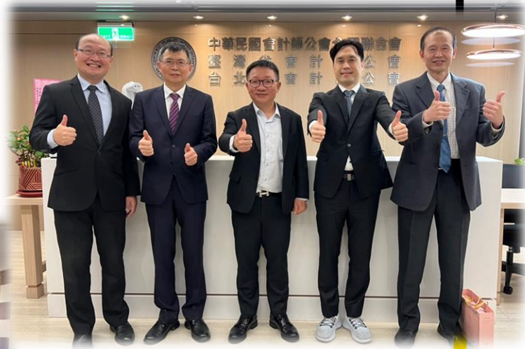
社團法人 中華民國會計師 公會全國聯合會