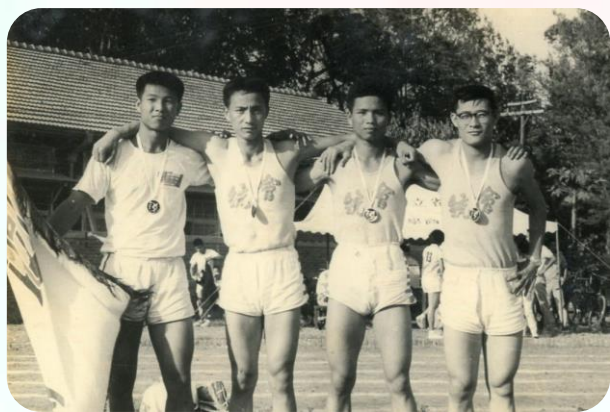
第六屆校運會400公尺接力賽冠軍 (右一為本人)

2020東京奧運柔道項目男子60公斤級銀牌得主楊勇緯先生，是臺灣首位贏得奧運柔道獎牌的運動員，寫下臺灣柔道史上新頁章，舉國振奮，何等榮耀，對於學習柔道逾半世紀的我而言，也感到與有榮焉。民國48年，我考上成大會計統計學系，因緣際會參加學校柔道社，從柔道練習中，在塌塌米上論道，領悟以柔克剛、道上修身的哲理，學習千錘百鍊、久鍊成鋼、熟能生巧、巧能生精的功夫，更從柔道特有的「半勝」規則中，修得凡事不輕言放棄的堅忍毅力。成大四年的成長和歷練，影響一生至鉅，也是我人生淬鍊，奮鬥不懈的原動力。