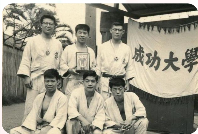
51年全國大專柔道錦標賽團體季軍 (右站一為本人)

當時，成大商學院甫成立三年，歷屆校運會會統系選手鮮少入選名次，我以「事在人為」的信念和「永不認輸」的精神，曾獲得多次優勝，為母系爭取榮譽，引為畢生樂事，茲列舉如下：①成大校長盃柔道錦標賽蟬聯三屆冠軍 ②成大第五屆柔道錦標賽冠軍 ③第五屆校運會鉛球賽季軍 ④第六屆校運會400公尺接力賽冠軍 ⑤第七屆校運會400公尺接力賽亞軍 ⑥陸軍官校38週年校慶柔道對抗賽雙料冠軍 ⑦51年全國大專柔道錦標賽團體季軍 ⑧52年全國柔道錦標賽大專組個人亞軍，榮獲蔣經國主任頒贈錦旗。