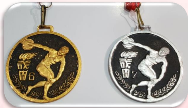
第六屆校運會400公尺接力賽冠軍、 第七屆校運會400公尺接力賽亞軍 獎牌