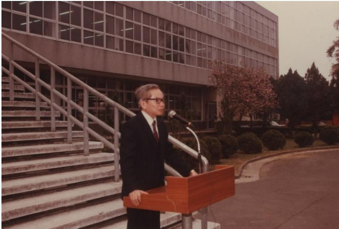
成大前校長 夏漢民