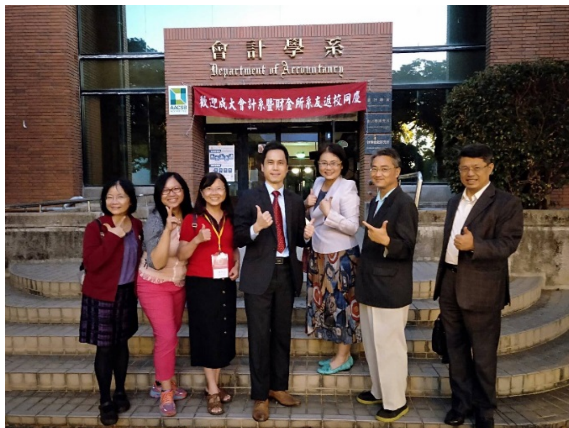
11/10 78級與107級系友回到母系與主任合影