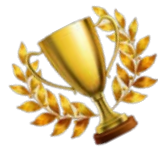
會計系男籃 區域賽冠軍