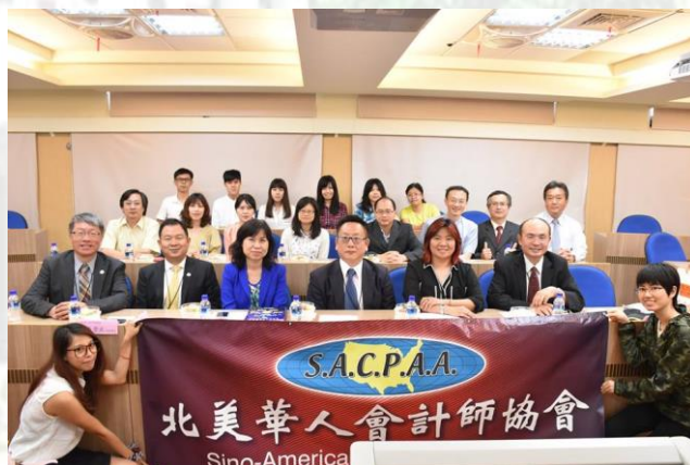
北美華人會計師協會與師生們合影