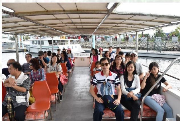
系友聯誼活動合照