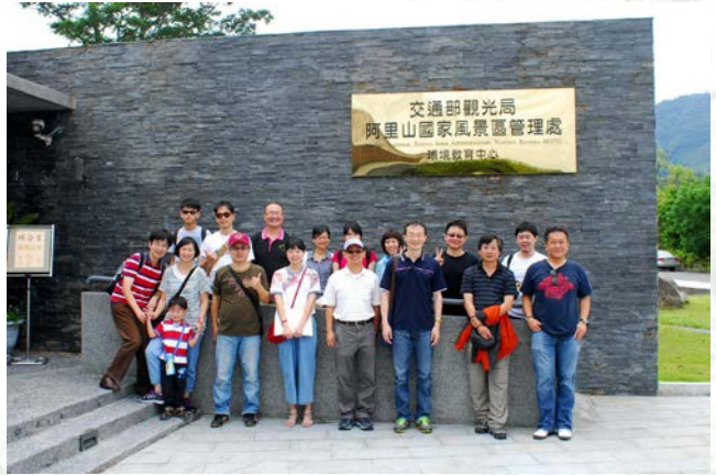
系上教職員於風景管理處前合影