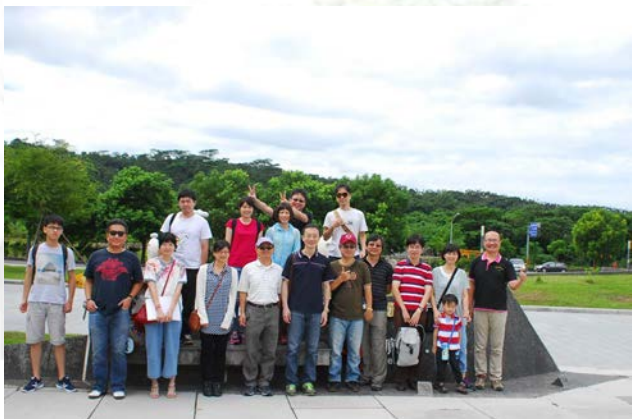
系上教職員在奮起湖前合影