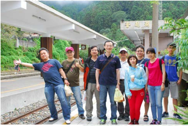
系上教職員於車站前合影