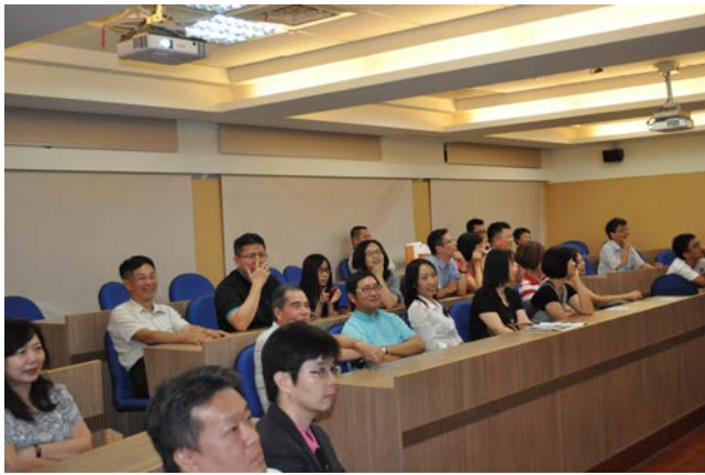
59 級系友於簡報活動現場聆聽系況介紹