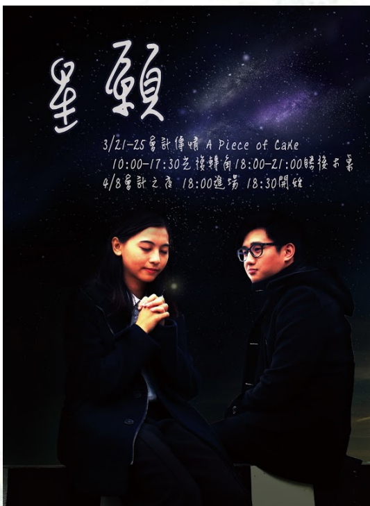
會計週活動—會計傳情海報

註 ④：學生活動項目為舉辦小畢業於 106 實際支出為$7,226，因安永會計師事務所贊助$4,000，故將場地費提高，而往年實支為四千多；會計之夜與會計週獲贈來源為四大會計師事務所。