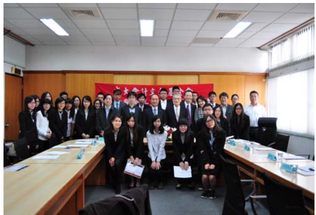
頒獎人及全體受獎同學合影