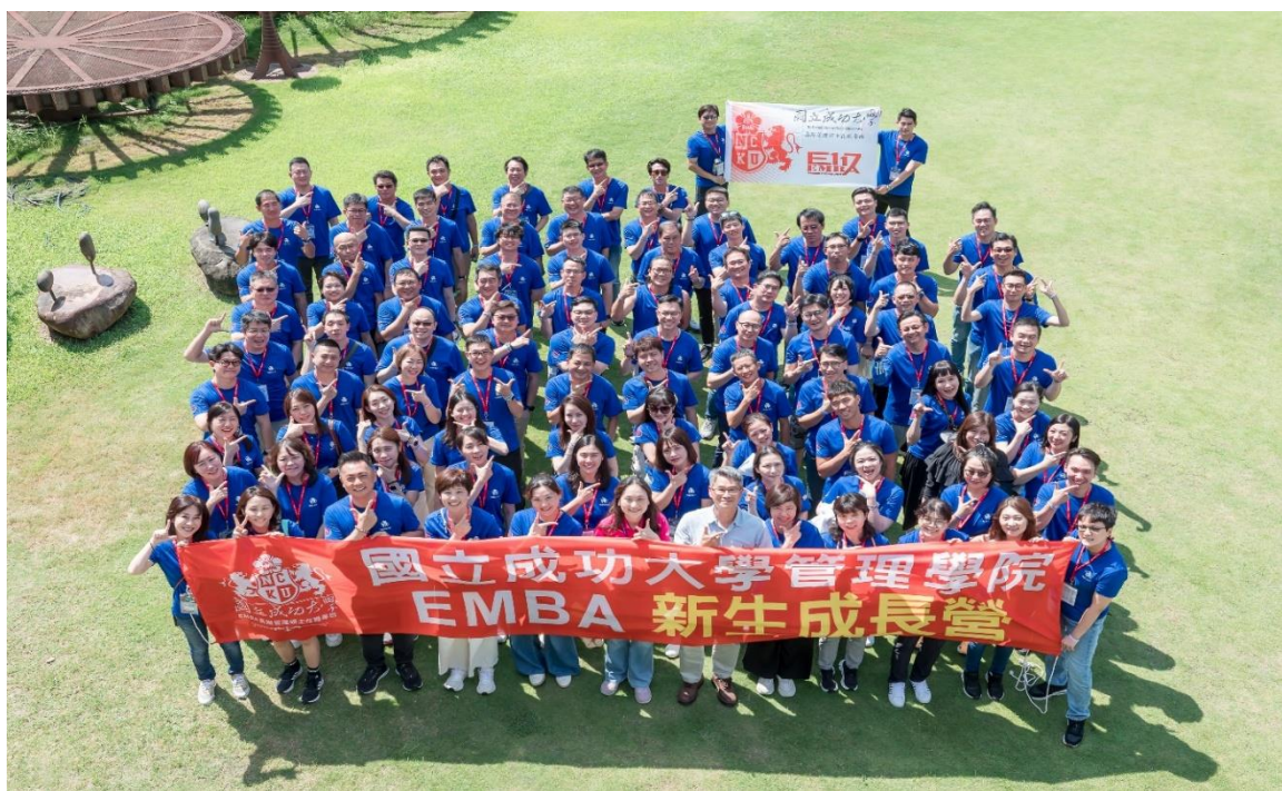
成大 EMBA 於 8 月 9 日至 10 日，在臺南十鼓文創園區舉辦 E117 級新生營

國立成功大學 EMBA 於 8 月 9 日至 10 日，在臺南十鼓文創園區舉辦 E117 級新生營。今（2025）年主題為「創藝 17 · 新動未來」，象徵新生學習旅程的正式啟動，也寓意學員以「歸零」的心態探索知識新境界。活動地點選於由舊糖廠活化再生的十鼓文創園區，融合傳統與創新精神，呼應 EMBA 課程理論與產業實務緊密結合的特色。