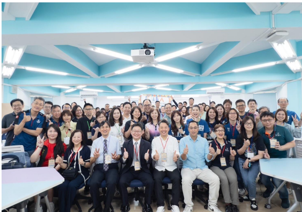
「頂尖國立大學 EMBA 北區聯合課程」集結清華大學、臺灣科技大學、中央大學、中山大學與成功大學師資與學員

國立成功大學 EMBA 今（2025）年 6 月首度北上主辦「頂尖國立大學 EMBA 北區聯合課程」，為南北學術資源的融合共學揭開新頁。為期 4 天的課程 6 月 28 日展開，邀請清華大學、臺灣科技大學、中央大學、中山大學與成功大學等 5 所頂尖學府的優秀師資，共同構築一場知識與實踐交織、理論與經驗交會的高階管理教育盛典。