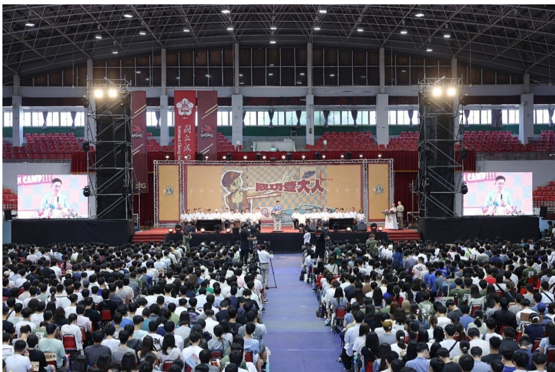
國立成功大學 114 學年度新鮮人成長營「第 15 屆成功登大人」9 月 3 日上午在光復校區中正堂盛大開幕

國立成功大學 114 學年度新鮮人成長營「第 15 屆成功登大人」9 月 3 日上午在光復校區中正堂盛大登場。成大校長沈孟儒帶領一級主管熱烈歡迎新鮮人加入成大大家庭，並勉勵新生盡情學習享受大學生活，將此刻初來乍到的徬徨與不安，蛻變為在畢業典禮上對未來充滿希望且閃閃發亮的眼睛。