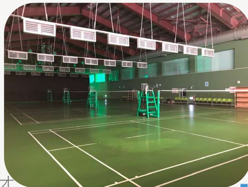
羽球場 排球場 籃球場